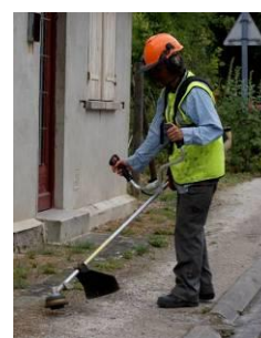
Débroussailleuse à fil