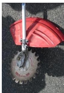
Débroussailleuse à lames réciproques

Pour l'enherbement semé, il est important de choisir des semis de végétaux résistants au piétinement et à la sécheresse.